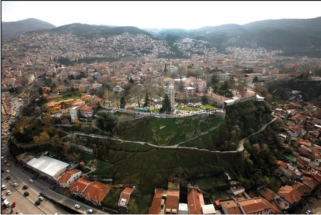
Şekil 2. Doğal Bir Kale Görünümüne Sahip Bursa Traverten Terasının Altıparmak Caddesi'nin Güneyinde Kalan Kısmı.

Bursa şehrinin ilk kurulduğu yer, bugün Hisar Sementi denilen alandır. Bu alan, doğal bir kale formunda olup, üç tarafı derin uçurluklarla çevrelenmiş bir traverten terası üzerinde bulunmaktadır. Şehir içinde bulunan fay kaynakları bu oluşumun meydana gelmesinde etkili olmuştur. Bursa şehrinin nüvesini oluşturan bu traverten terasının Altıparmak Caddesi'nin güneyinde kalan kısmı (Şekil 2) en dik yerlerinden biri olup yaklaşık 40 m'lik bir sarplık teşkil eder. Şehrin her yerinden görülen bu yüksek teras Bursa Hisarı'dır (Ergenç, 2006:16). Şehirlerin kuruluş yerinin belirlenmesinde önemli olan faktörlerden biri de kolay savunabilir olması ve güvenlik ihtiyacını karşılayabilecek nitelikte olmasıdır. Kaleler, şehrin gelişimini belirlemekle beraber düşman saldırıları ve yağmalamalara karşı koymada etkili olan yapılardır (Yiğit, 2019: 205). İşte, Bursa Hisarı da tam bu nedenle doğal bir kale formuna sahiptir ve savunma savaşlarında surlar önemini kaybedene dek fethedilmesi zor bir şehir olmuştur.