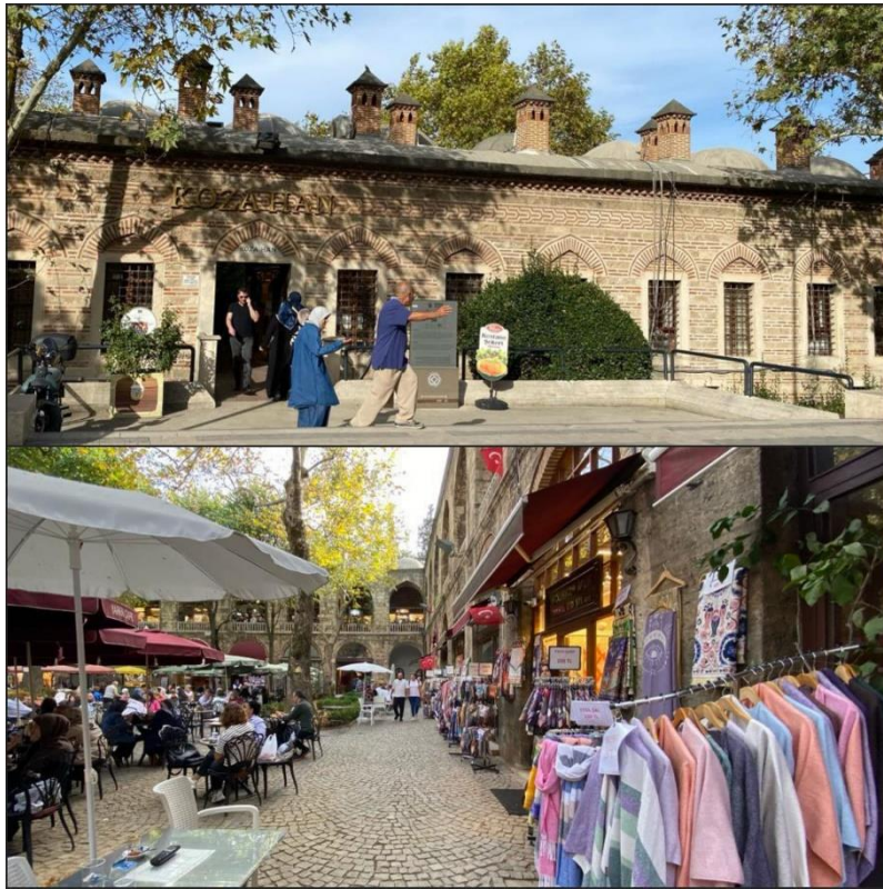
Şekil 3. Kozahane'nin Dışından ve İçinden Görünümü.

Ankara Savaşı'ndan 1413 yılına kadar süren 11 yıllık fetret döneminde Bursa şehri, Yıldırım Beyazıt'ın oğulları arasında geçen taht kavgalarından olumsuz etkilenmiştir. Diğer şehzadelere üstünlük kurarak tek başına tahta geçen I. Mehmet'in (Çelebi), Orhan Gazi Külliyesi ile Yıldırım Külliyesi arasındaki boşluğa yaptırdığı Yeşil Külliye, şehrin gelişim yönünü belirlemiştir. Böylelikle, Setbaşı ve Emir Sultan'a doğru birleşme sağlanmıştır. Muradiye Külliyesi'nin yapılmasıyla beraber şehrin kendine has dokusu II. Murat döneminde oturmaya başlamıştır (Ergenç, 2006: 20-21). Bu dönemde Bursa'ya gelen Fransız seyyah Bertrandon de la Broquiere, Bursa'nın önemli bir ticari merkez ve Türklerin en muazzam beldesi olduğunu belirtir (De La Broquiere, 1892: 131-137).