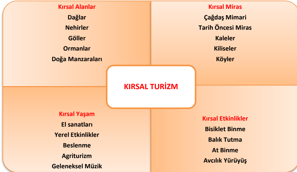
Şekil 1. Kırsal Turizm Bileşenleri

Bir kavram olarak kırsal turizmi daha iyi anlayabilmek için kırsal turizm bileşenlerinin tanımlanmasında fayda vardır. Adı geçen bileşenler kırsal alanlar, kırsal miras, kırsal yaşam ve kırsal etkinliklerden oluşmaktadır (Şekil 1). Bu bileşenler, aynı zamanda kırsal turizmin temel arz kaynakları olması açısından da oldukça önemlidir (Çeken, 2020).