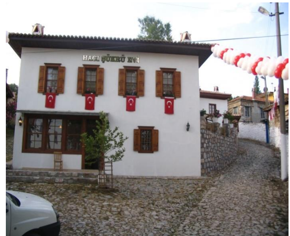
Şekil 3. Bozüyük Mahalle Meydanı ve Büyükşehir Belediyesi Tarafından Restorasyonu Yapılan Hacı Şükrü Evi