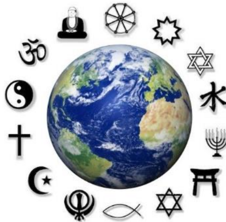
Şekil 2. Dünyada başlıca inançların sembolleri

Dünya üzerinde inançlar doğmuş gelişmiş ve zaman içinde kendi kimliğini bularak şekillenmiştir. Her inanç kendi coğrafyasında çevresindeki coğrafi özelliklerinde etkisinde kalarak, belirli gelenekler ve ritüeller oluşturarak, bunları kendi bünyesinde simgeleştirmiştir. Bu simgelerde günümüz dünyasında kendi coğrafyasında şekillenmiş ve yaygınlaşarak dünya üzerindeki inanç coğrafyasını oluşturmuştur (Şekil 2).